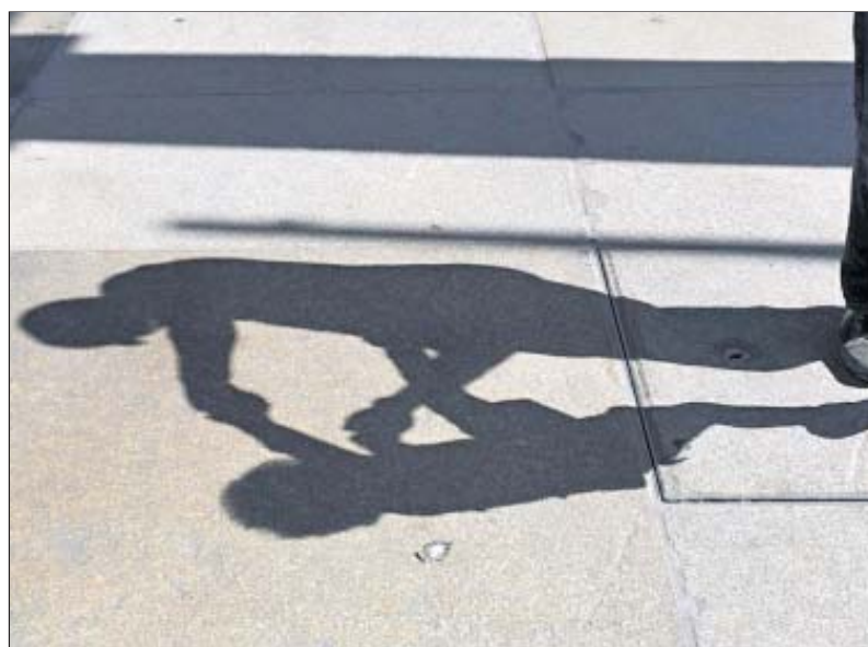
Schattenriss: Ein Vater misshandelt sein Kind. Deutsche Jugendämter nehmen immer mehr Jungen und Mädchen unter ihre Aufsicht.

Oberstes Ziel: Den Schutz des betroffenen Kindes umgehend sicher-