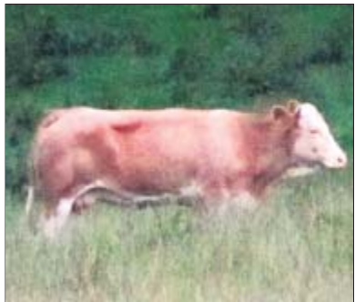
Yvonne am 21. Juli in der Nähe von Mühdorf in Oberbayern.

Mühdorf – Die Kuh Yvonne lebt bei Zangdorf im Landkreis Mühdorf am Inn regelrecht im Schlaraffenland: Sie hat satt an Gewicht zugelegt, wie Hans Wintersteller von Gut Aiderbichl am Dienstag bestätigte. „50 oder 60 Kilogramm hat sie garantiert zugenommen“, sagte er. Auf den Feldern findet sie Mais, außerdem gibt es leckeren Klee und mehr als genug Gras. „Sie hat die ganze Nacht Zeit zum Fressen“, sagt Wintersteller. Die ehemalige Milchkuh aus Österreich war am 24. Mai ihrem neuen bayeri-